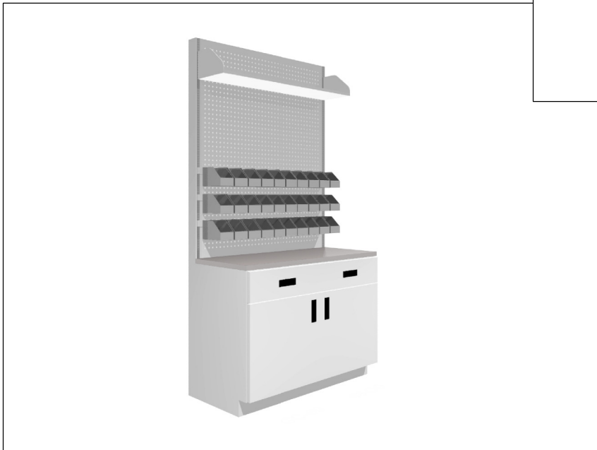
Mesa de Almacen DISEÑO "C"